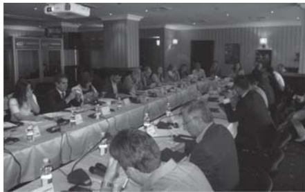
Проектът „От Черно до Егейско море„

Бе проведена и първата организационна среща, на която освен председателите на двете палати и екипа на проекта присъстваха и членове на управителните органи.