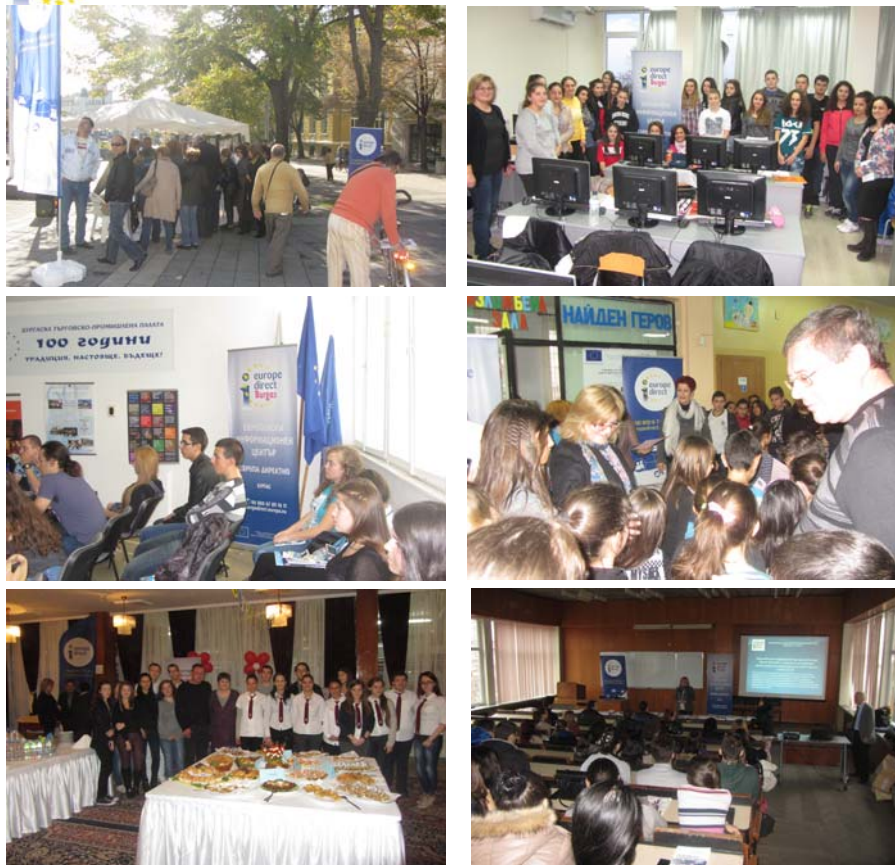
Подробен информация за дейността на Европейски информационен център "Европа директно - Бургас може да намерите на: www.europedirect-burgas.com

Бургаската търговско промишлена палата предлага на своите членове информация за изложбен календар за първите месеци на 2015 г. Изложенията се организират в Интер Експо Център – гр. София, който е партньор на Бургаската палата. ИЕЦ София предоставя електронна покана за безплатен вход в съответната изложба и съпътстващите я бизнес събития за членове на БСТПП. За повече информация: тел.: 056 812007