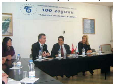
Работна група от Лозенград