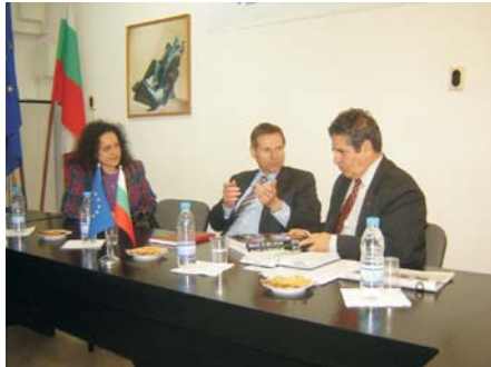
Посещение на Посланика на Белгия