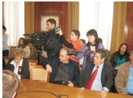
Дискусия - индустриален парк