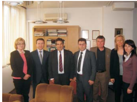
Делегация от Люлебургаз

(от стр. 1.) та ще осъществи контакт с ТПП в гр. Гент, център на регион със сходни икономически показатели.